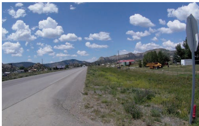
Delphine Renault, Off road , 2014 vidéo - 27 minutes Edition de 3 + 1 E.A