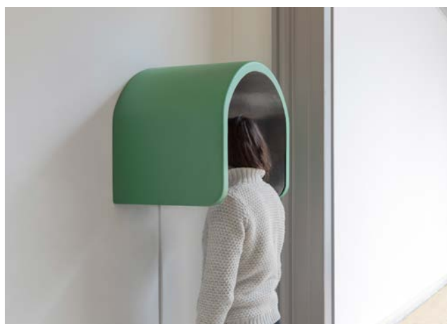
Delphine Renault, Coucou , 2015 Isoloir téléphonique sonorisé Pièce unique