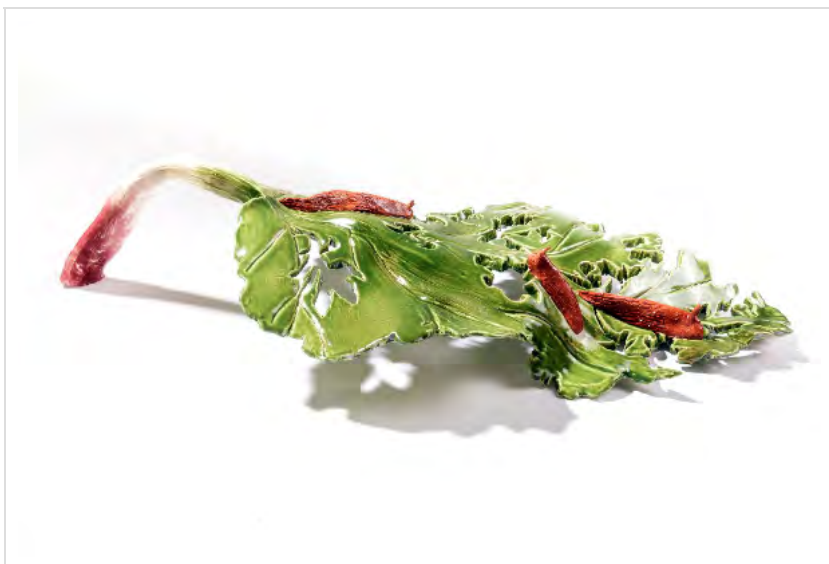
Sébastien Gouju, Domestique (rhubarbe) , 2013, faïence émaillée.

L'hiver glacé semble enfin avoir fait son entrée à Paris, mais il n'y a rien là qui puisse effrayer les insatiables amateurs d'art contemporain, pour lesquels la visite des galeries est une hygiène tant physique que sensible. Comme d'habitude, l'actualité est riche, mais exponaute vous aide à faire le tri.