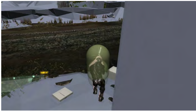
Harun Farocki, Parallel II (Still) , 2012-2014, video installation. Courtesy galerie Thaddaeus Ropac, Paris.